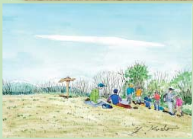
「東根山」春、山頂はシラネアオイで咲き乱れ、北側に振り向くと雪を残した岩手山を望む・・・

「・・・頂上は360度さえずるものが無く、遠くまで景色を見ることが出来る場所、苦勞して登った達成感を味わうことが出来る場所です。せっかく頂上に着いたのにちょっとだけ休んで直ぐ下山する人やゆっくりおにぎりを食べて一眠りしている人、写真撮影に一生懸命な人のようにさまざまな登山者の姿、山頂の形状の違いで人々の休み方の違いなどを見て、この風景を絵にしようとして水彩画に描いてみました。(本人談)