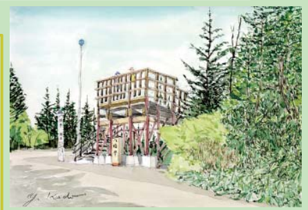
「八幡平」山頂とはいえ、八幡平は山頂といった形状を成してなく、周りは樹木で覆われて・・・

「・・・頂上は360度さえずるものが無く、遠くまで景色を見ることが出来る場所、苦勞して登った達成感を味わうことが出来る場所です。せっかく頂上に着いたのにちょっとだけ休んで直ぐ下山する人やゆっくりおにぎりを食べて一眠りしている人、写真撮影に一生懸命な人のようにさまざまな登山者の姿、山頂の形状の違いで人々の休み方の違いなどを見て、この風景を絵にしようとして水彩画に描いてみました。(本人談)